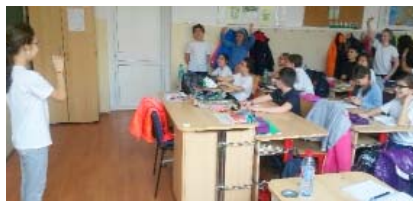
Scoala gimnaziala nr 31

Temele abordate au vizat intelegerea mecanismelor conflictelor care au loc in fiecare clasa, a cauzelor si consecintelor