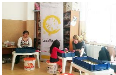
DGASPC 4, Centrul Comunitar Sf. Vasile