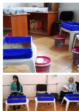
Scoala gimnaziala 114 "Principesa Margareta"