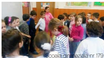
Scoala gimnaziala nr 179

acestora, descoperirea alternativelor non-violente de solutionare a acestora si cultivarea unei atitudini reconciliante.