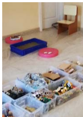
DGASPC 6, Centrul pentru copiii cu dizabilitati Orsova