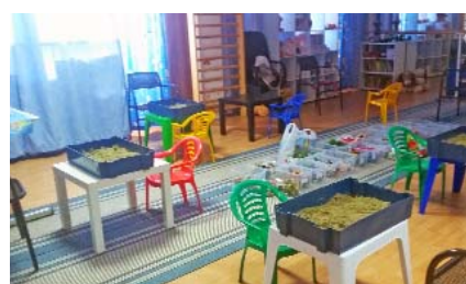
Fundatia Mia's Children