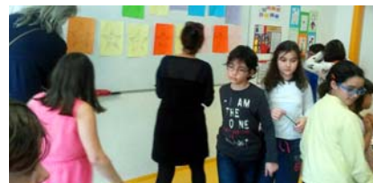
"Aprecierea diversitatii"- Ziua Portilor deschise Scoala Aletheea

Empatia si responsabilitatea sociala se promoveaza cel mai bine prin exemplul propriu. Ne-am adus si noi contributia la pregatirea copiilor de la Fundatia Sfanta Macrina, pentru cel de-al doilea semestru scolar.